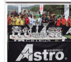
Trofeos y regalos